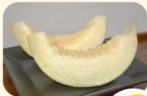
『エリザベスメロン』 上品な甘さ。今が食べ頃!