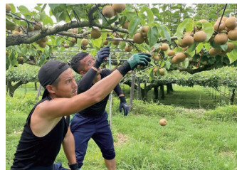
▲真剣な眼差し！飲み込みが早いと評判です

今月は人手不足の梨農家さんのもとに集中的にお手伝いに向っています。お困りの農家さんは 0983-32-0137 まで気軽にご相談ください！