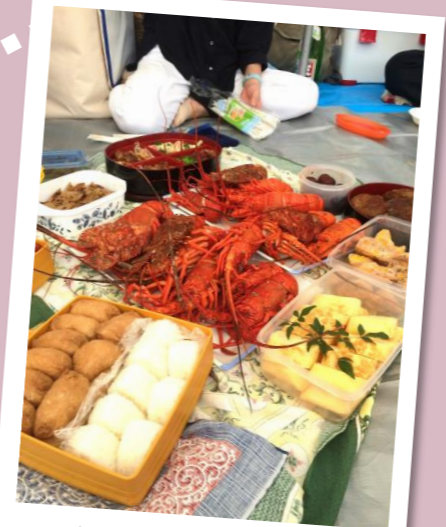
運動会のお楽しみ