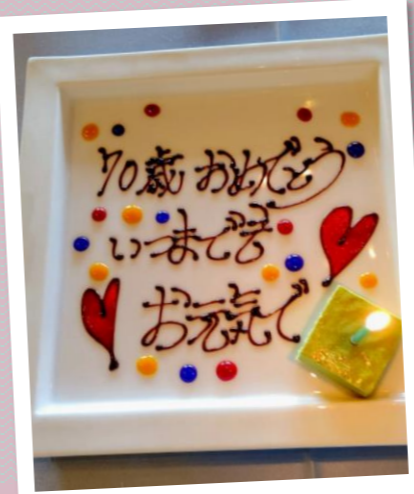
いつまでも元気でいてね!