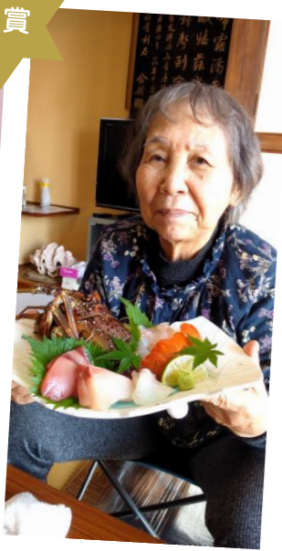
1年に1回の 贅沢伊勢海老