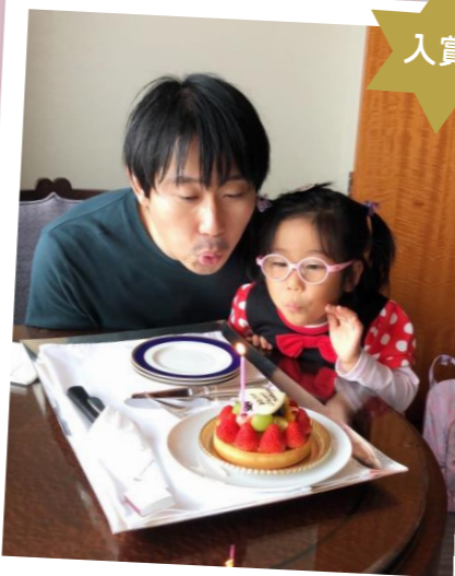
どっちが主役!? (ハッピーバースデーパパ♪)