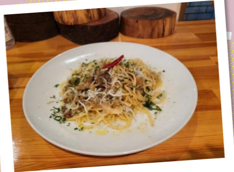
わたしのお気に入りパスタ