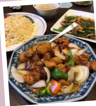
★★★★ 星三つ ★★★★★

NAVI PHOTO GRAND PRIX 【10月テーマ】 食欲の秋・美味しいフォト