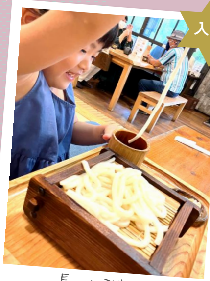
長ーいうどんも 上手に食べれるよ