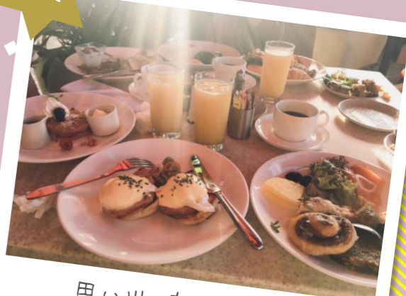
思い出の朝ごはん