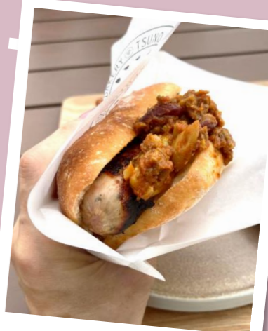
テラスでいただきます♡