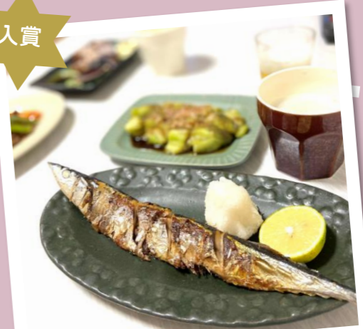
秋は痩せる日段なし