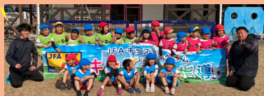
綾町立中坪保育所でコーチとして参加