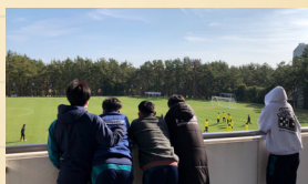
宮崎ならではの贅沢な環境をカに

休日にJリーグのキャンプ見学へ。憧れのプロサッカー選手のプレーに大きな刺激を受け、日々の練習に良い変化が生まれているようです。