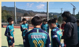
2/23は木城町でVS串間中の予定

宮崎県U-15サッカーリーグ・県3部が先月開幕し、前節のソレッソ宮崎戦は0-15で敗戦。課題はたくさんありますが成長を見せた部分もあり、今後に期待！