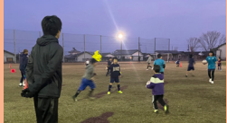
サポート&アップメニューを担当！