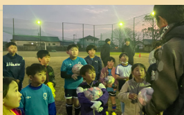
進学前の年長・小学生クラスの参加も可能！

スクールに通う生徒の数が100名を超えました。新学期に向けて、体験も随時募集しています。一緒に楽しく体を動かしましょう！